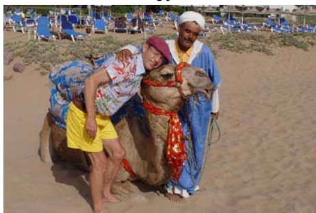
la faune locale