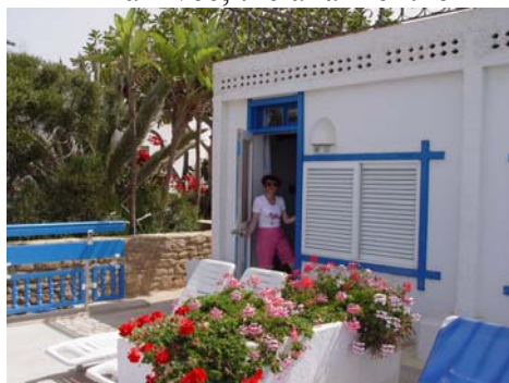
on découvre nos chambres