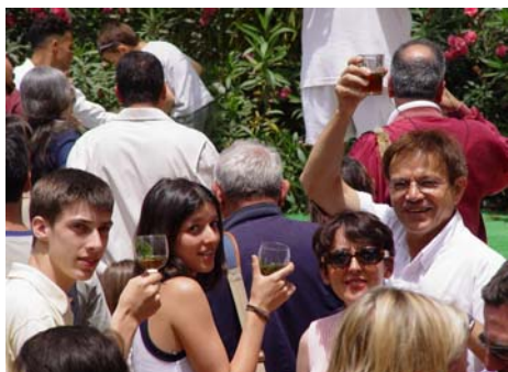
A l'arrivée, thé à la menthe