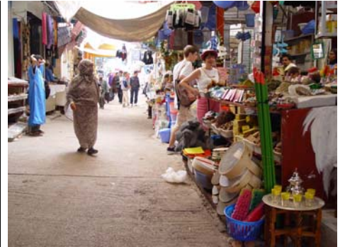
on trouve tout et