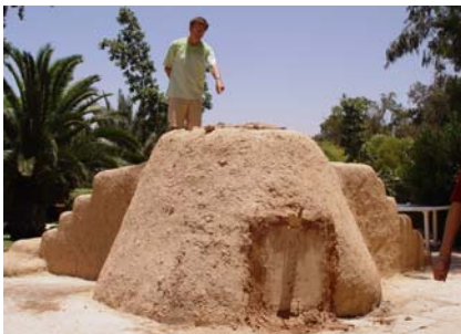
Les agneaux sont dedans