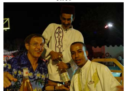
et ses adjoints