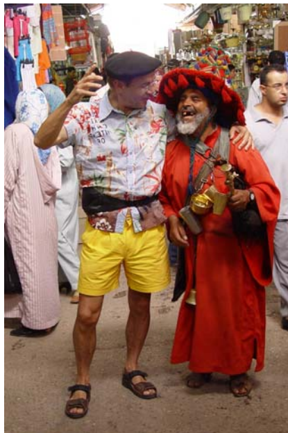
à la tienne