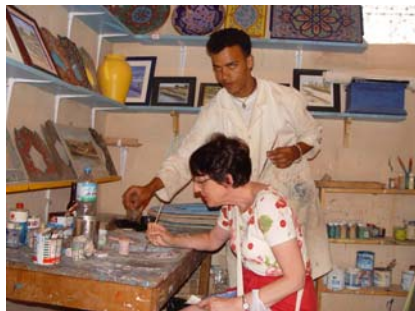
l'art du pinceau