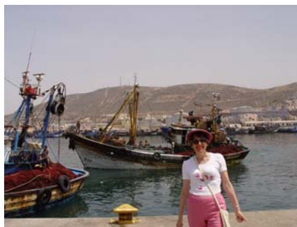
des gros bateaux