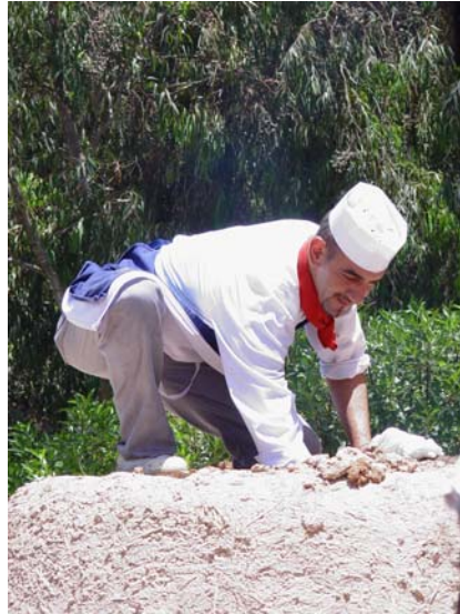
et cuits à point