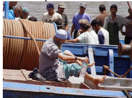
se rafraîchir les pieds