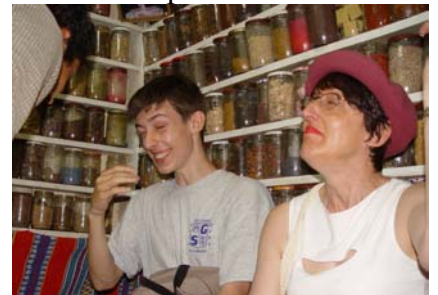
ça sent fort