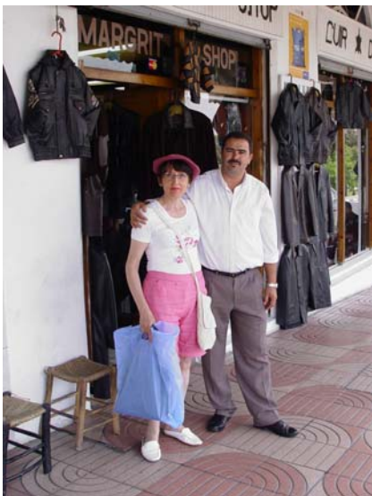
après deux heures de discussions