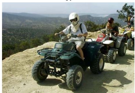
le Quad en montagne