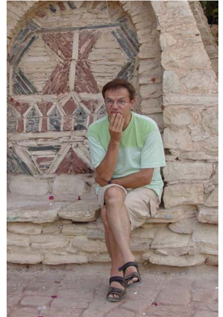
le taxi nous a oublié