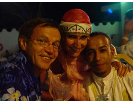
entente franco- marocaine