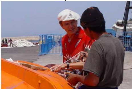
leçon de calfatage