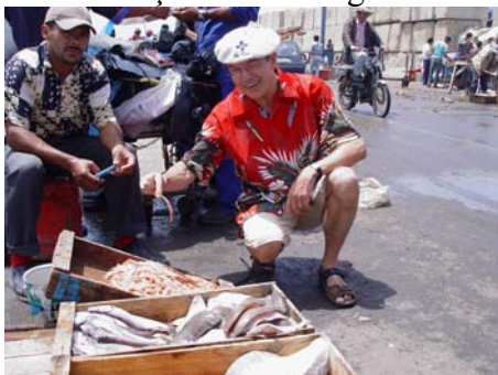
pas cher, mon ami