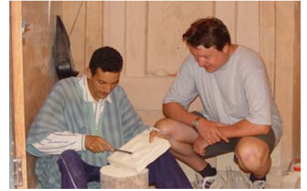
et du moulage