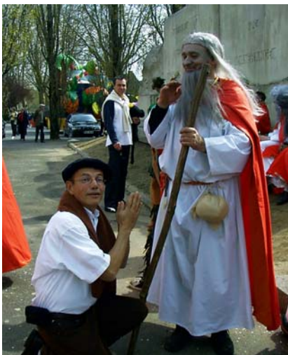
d'une grande piété,